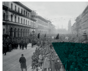
DEMONSTRATION VON ANHÄNGERN DER MÜNCHNER RÄTEREPUBLIK IN DER LUDWIGSTRASSE IN MÜNCHEN, 22. APRIL 1919