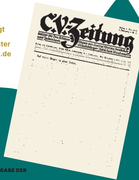
TITELSEITE DER ERSTEN AUSGABE DER CV-ZEITUNG, 4. MAI 1922

Anmeldung erbeten unter empfang@jmaugsburg.de oder Tel. 0821-51 36 11