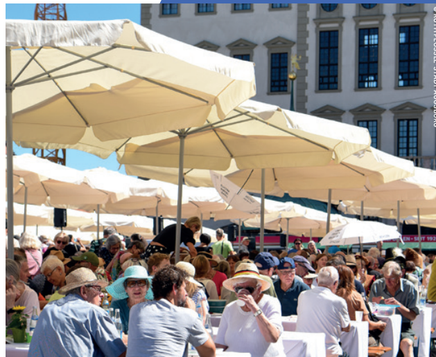
FRIEDENSTAFEL AUF DEM AUGSBURGER RATHAUSPLATZ, 2025

EINE VERANSTALTUNG IM RAHMEN DES KULTURPROGRAMMS ZUM AUGSBURGER FRIEDENSFEST*26 IN KOOPERATION MIT DER FRIEDENS- STADT AUGSBURG