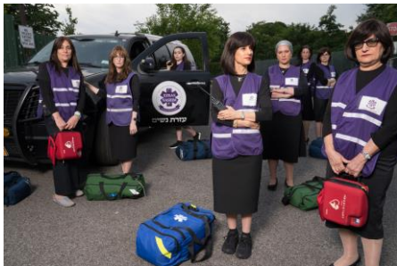
F_PM_93Queen Szene: © Julieta Cervantes

Über einen Hinweis auf den Film sowie eine Berichterstattung freuen wir uns. Für Fragen stehen wir gerne bereit.